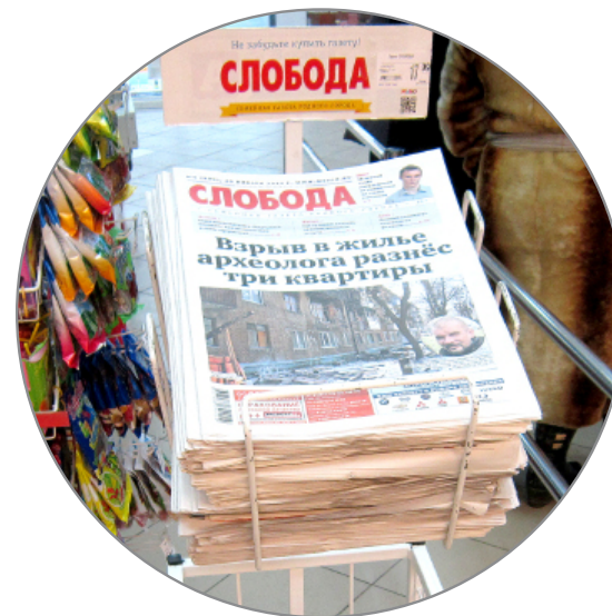
Супермаркеты 28 000 экз.