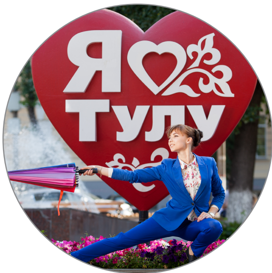
Тула 42 000 экз.