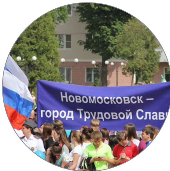
Тульская область 30 000 экз.